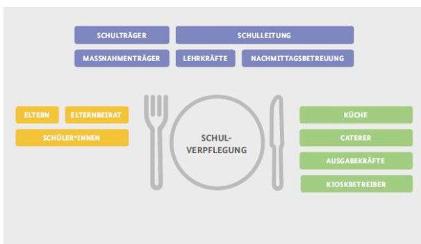
Abbildung 1 Ausgewählte Akteur*innen in der Schulverpflegung

Die Organisation von Schulverpflegung ist eine komplexe Aufgabe, da so viele verschiedene Akteure mit auch verschiedenen Zielen an ihr beteiligt sind.